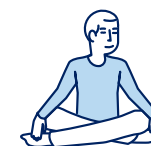
Je fais des activités sans effort