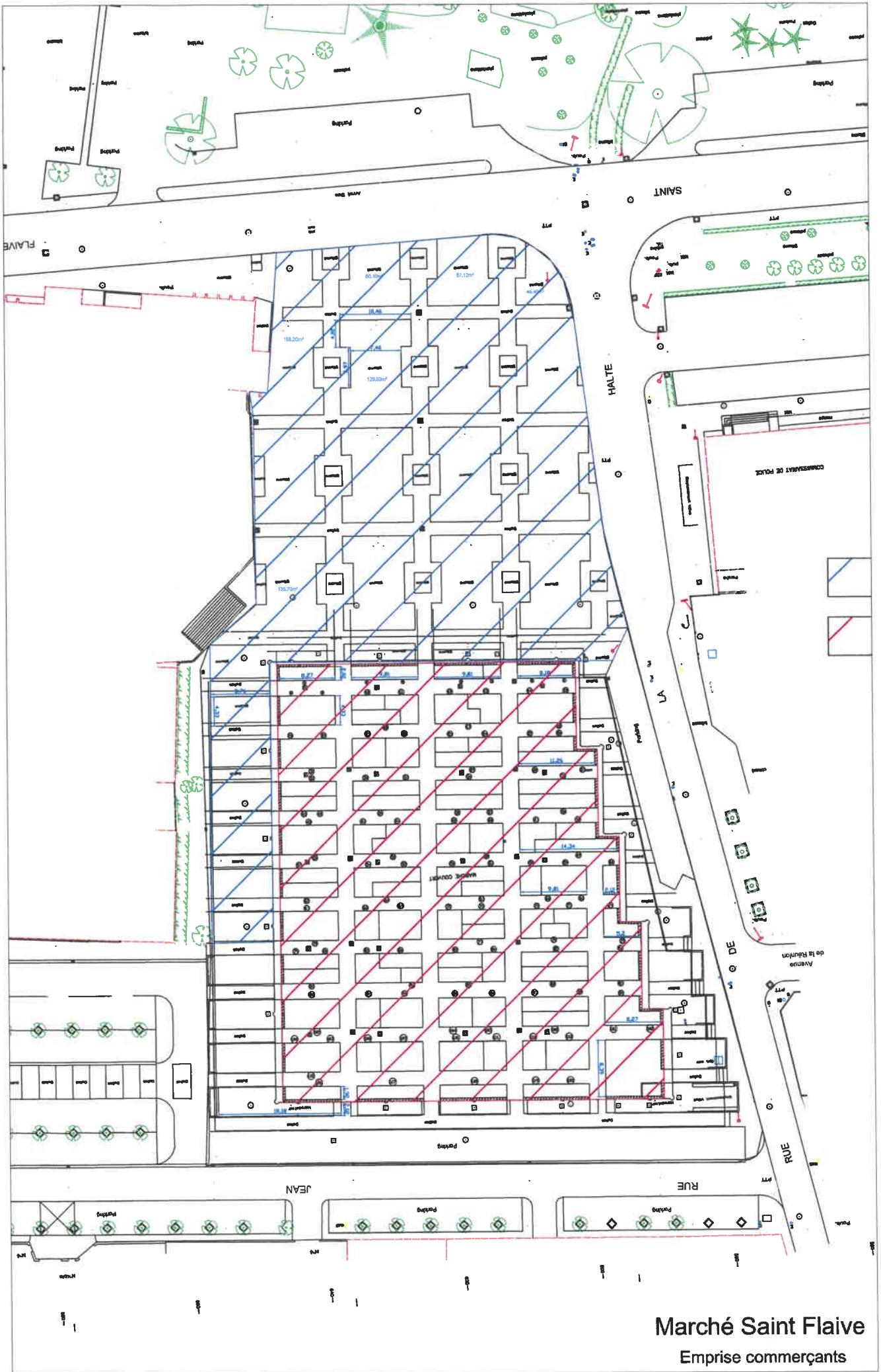
Marché Saint Flaive Emprise commerçants