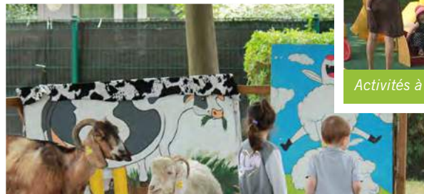
Fête aux Gibus