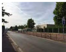
Installation de barrières fixes devant tous les sites.