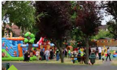
Spectacle au multi-accueil À Petits Pas