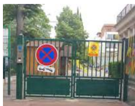
Installation de visiophones, renforcement et pose de clôtures.

Cette année, la Municipalité a renforcé la sécurité des accès et des abords des écoles en engageant d'importants travaux dans les bâtiments scolaires : renforcement et pose de mobilier urbain, installation de visiophones, de systèmes d'alarme et de communication. La Municipalité a également interdit le stationnement de véhicules aux abords des établissements scolaires et régulé la circulation.