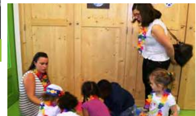
Fête des Bouquinilles