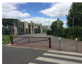
Pose d'une barrière ouvrable devant le lycée professionnel Gustave-Eiffel.