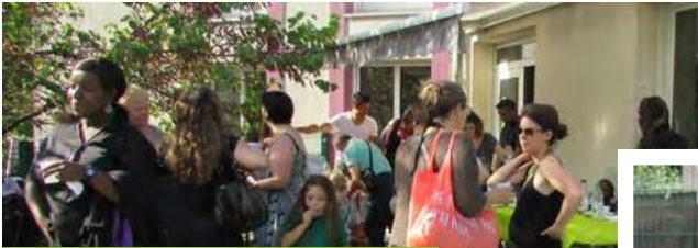
Exposition photos à la crèche familiale Les Marmousets