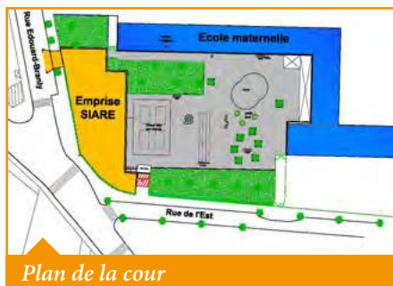
Plan de la cour

La cour de récréation a été refaite cet été pour que les élèves puissent se la réapproprier dès la rentrée. De nouveaux enrobés, des tracés de jeux au sol et une structure de jeux ont été mis en place. Pendant les vacances d'octobre, lorsque la saison deviendra propice aux plantations, le SIARE réalisera les espaces verts et la Municipalité plantera une nouvelle structure de jeux.