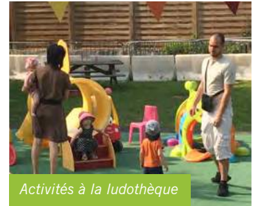
Activités à la ludothèque